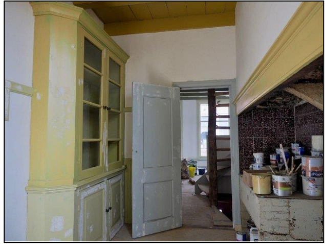
Links de begane grond van Hogewoerd 61A. Rechts de historische keuken op de eerste verdieping van Hogewoerd 61.