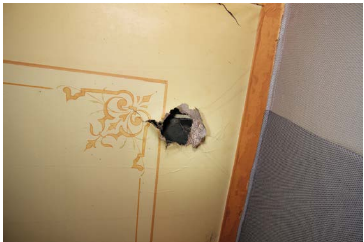
Detail van het spanplafond in nummer 59, dat op veel plekken niet meer te restaureren was. Er voor in de plaats kwamen met de hand vervaardigde replica's.