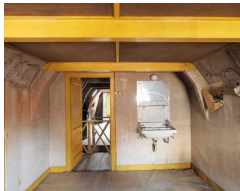
Een van de dienstbodekamers met elektra, kasten, afgeschoten pannendak en een wasbak.

Meer subtiel en een aardig detail is het drukknopje van bakeliet naast de deur op de eerste etage; een vroeg soort kunststof dat sinds de jaren tien van de twintigste eeuw werd gebruikt. 23 Het is een dienstbodebelletje dat hard nodig was in dit verheelde grote pand. Waar het signaal afging is niet duidelijk, maar dat zal ongetwijfeld ook op de kamertjes zijn geweest die boven op de zolder van nummer 61 waren gebouwd als slaap/verblijfplek voor de hulpen in de huishouding. Dat waren lage ruimten met voldoende plaats voor een bed, een stoel en een kastje. Deze hadden tevens