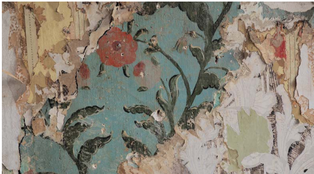
Op de westmuur van nummer 61A kwamen maar liefst 25 lagen behang tevoorschijn: een staalkaart van behangen uit de afgelopen tweehonderd jaar. Onder de behanglagen zat een bijzondere muurschildering, die ook werd aangetroffen op twee als bouwmaterialen hergebruikte deurtjes in hetzelfde pand.

Tot zover de ontdekkingstocht aan de Hogewoerd, waar zowel het bestuur van Diogenes als menig Leidenaar via de opeenvolgende Open Monumentendagen en de nieuwsbrieven veel plezier aan heeft beleefd. Meer over de stichting en haar panden is te vinden op www.diogenes-leiden.nl .