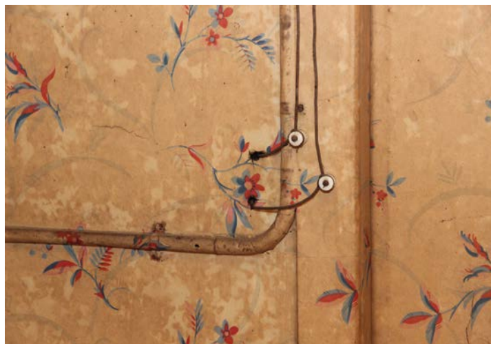
Restant van de oude elektriciteitsvoorziening in nummer 59. De ijzeren elektriciteitspijp is van later datum.

Bovendien zijn er op deze wanden twee lagen behang op jute aangetroffen. De onderste laag met late art nouveau-motieven, is te dateren van 1915 tot 1925, ter-