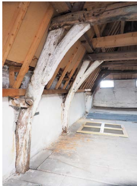
De hergebruikte houten krommers, te zien op de zolder van nummer 59, zijn aanmerkelijk ouder dan het pand zelf.

Ook op de samengestelde balklaag op de eerste verdieping is geen onderzoek gedaan. 11 Er moet immers een stuk uit het hout genomen worden voor zo'n onderzoek en daar wordt bij intacte balklagen liever vanaf gezien. Dröge had tenslotte al in zijn rapport