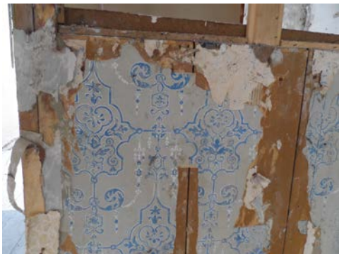
Fragment van het behang dat Piet Paaltjens moet hebben gezien toen hij op de Hogewoerd woonde. De resten zijn veilig gesteld door Erfgoed Leiden en Omgeving.