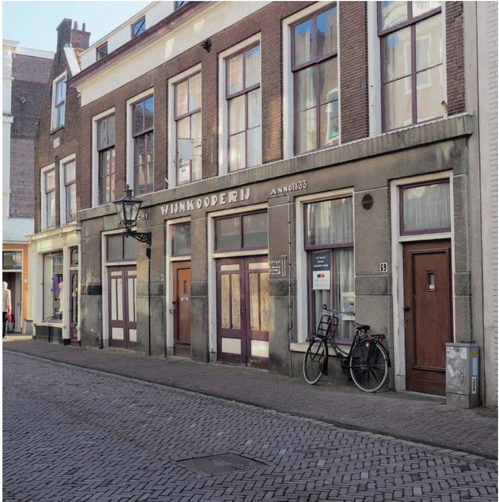
Het complex van vier huizen vóór de restauratie in 2014.