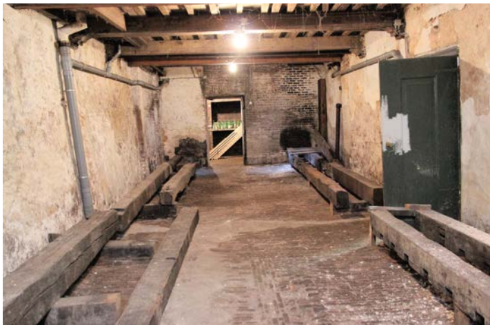
De balken waar wijnvaten op werden gelegd (huisnummer 61A). Rechts is een oude moerbalk te zien met inhammen voor de kinderbinten. In de doorgang in de achtermuur zat het flessengat. De betegelde spatrand is op deze foto niet te zien.

Er werden ook wat resten van eikenhouten planken waargenomen. Daarvan is aangenomen dat deze afkomstig waren van een vloertje waarop een smalle gemetselde toegang tot de waterput heeft gestaan. Deze eiken plaat is uiteindelijk in de vochtige grond verrot en heeft de inzinking van de vloer veroorzaakt, zo is de redenering. De flessen waren