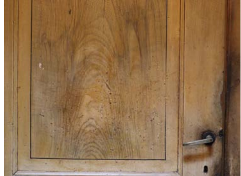
Voorbeeld van een deur voorzien van houtimitatie in de voormalige wijnkoperij. De meeste deuren zijn opgeknapt en hergebruikt.

Opvallend was dat de grootste kamer in de nieuwere achterbouw een wasgelegenheid had met een dubbele wasbak. Daarachter,