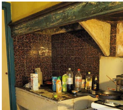
De keuken met de schildpadtegels boven het fornuis waarvan de werking niet duidelijk is. De panden waren tijdelijk door antikraak-bewoners in gebruik.

Bijzonder is daarnaast het lage hokje aan