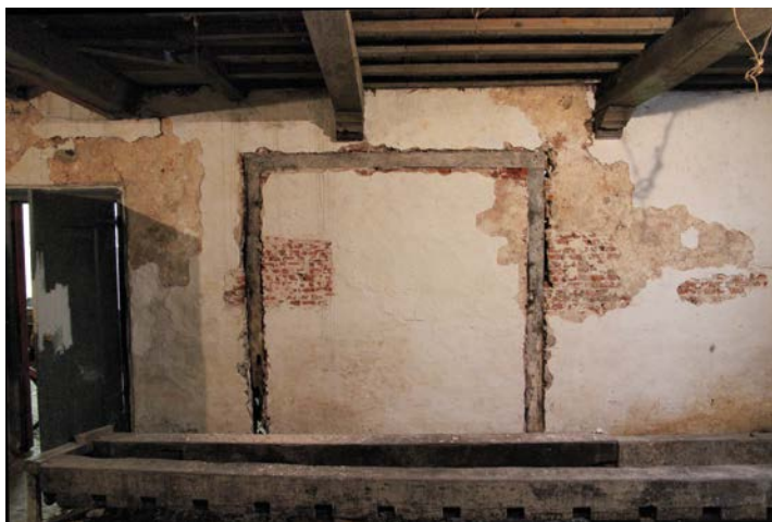
De met het verwijderen van los stucwerk ontdekte doorgang op de begane grond van nummer 61A naar nummer 61.

Naast de vondst van het flessengat, de waterputten en waterkelders is bij het afhalen van de oude stuclaag op de muren een dichtgezette doorgang gevonden, omzoomd door eiken balken. Het waarom van deze doorgang was aanvankelijk niet helemaal duidelijk. Verondersteld wordt nu dat de begane grond van dit pand, nu 61a, voor de eerste wijnkoperij in 1802 als opslag van de wijntonnen in gebruik is genomen. Aangezien dat pand zeer waarschijnlijk een woonruimte was, getuige de spattegels, zal de toegang vanaf de straat een gewone huisdeur zijn geweest. Daar kon