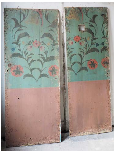
De geredde deurtjes waarop dezelfde schildering bleek te zitten als onder de vele lagen behang op de westmuur van nummer 61A.

van een waterkelder en stofschotten. Die schilderijen hebben overigens ook weer een nadeel voor de geschiedschrijving. Het is niet blijvend. Als de voorstelling ging vervelen werd het overgeschilderd of zoals hier, gelukkig, overgeplakt met papieren behang waardoor het bewaard is gebleven. De techniek is overigens goed terug te zien in het werk. Het is deels met repeterende sjablonen gemaakt en verder met een vrije hand ingevuld, hetgeen de schildering levendig maakt. De vondst is, zeker voor Leiden en uit die tijd, zonder meer zeldzaam te noemen. Overigens is er nog een uitzonderlijke en toevallige vondst gedaan die te maken heeft met deze