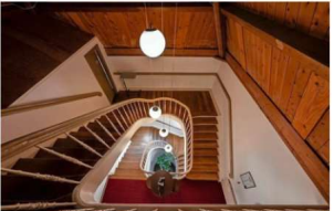
Een van drie trappenhuizen in het complex.

„Vroegste vermelding school stamt uit 1324”