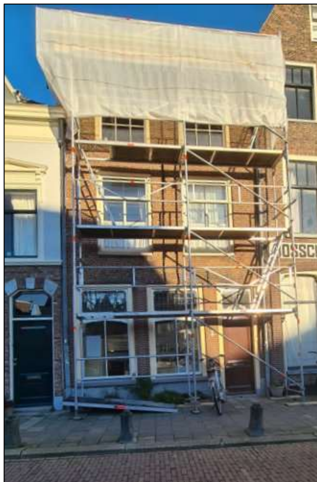
Nieuwe Rijn 74 in de steigers in 2021