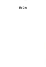
Zestiende-eeuwse klaslokalen doen dienst als kantoren.

„Niet alleen leuk naar een monument zitten kijken terwijl de zeespiegel omhoogkomt”