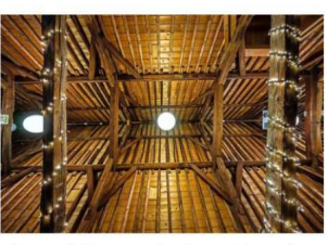
Wilbert Bots: „Kijk al die stammetjes dan... die kap is echt fantastisch.”