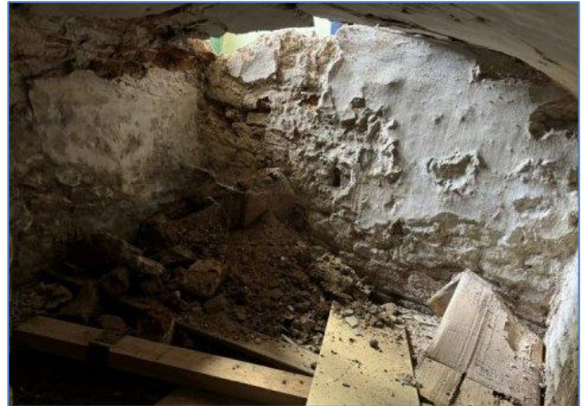
Linksboven: onder de vloer van de voormalige winkelruimte is een keldertje aanwezig. Rechtsboven: het keldertje gezien vanuit het pothuis.