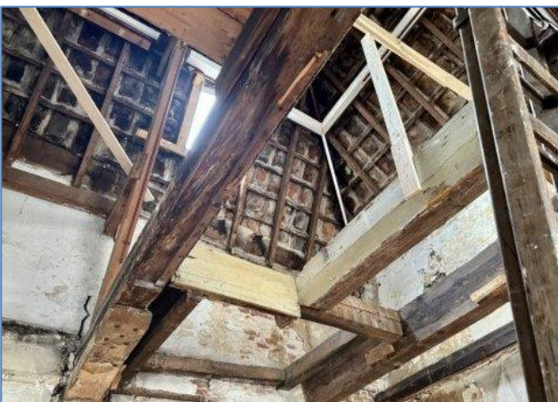
De foto hiernaast laat zien dat de smalle steile trap van de eerste naar de tweede verdieping gesloopt is. In de nieuwe situatie krijgt het bovenappartement een trapportaal op een andere plaats: achter de toegangsdeur aan de Rijnstraat. De vloer van de tweede verdieping bleek aan de achterkant heel slecht te zijn. Een aantal planken is nu weggehaald omdat ze onveilig waren. Ook sommige balken zullen moeten worden vervangen. De foto toont dat het pand een onbeschoten kap heeft: de dakpannen liggen direct op de dakspanten. Er komt dakbeschoot op de dakspanten met daarop eerst isolatiemateriaal en dan pas dakpannen.