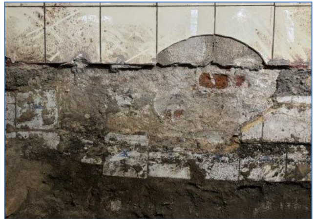
Links: bij het uitgraven van de vloer van het souterrain werd een oud waterreservoir gevonden. Vanuit dat reservoir liep een loden leiding in de richting van de plaats waar de waterpomp moet hebben gestaan. Rechts: de onderkant van de grotere tegels op de muur geeft het vloerniveau aan zoals dat tot voor kort was. Bij het uitgraven werden daaronder resten van Delftsblauwe tegeltjes aangetroffen. Die geven aan dat het oorspronkelijke vloerniveau van het souterrain zo'n 25 centimeter lager moet hebben gelegen.