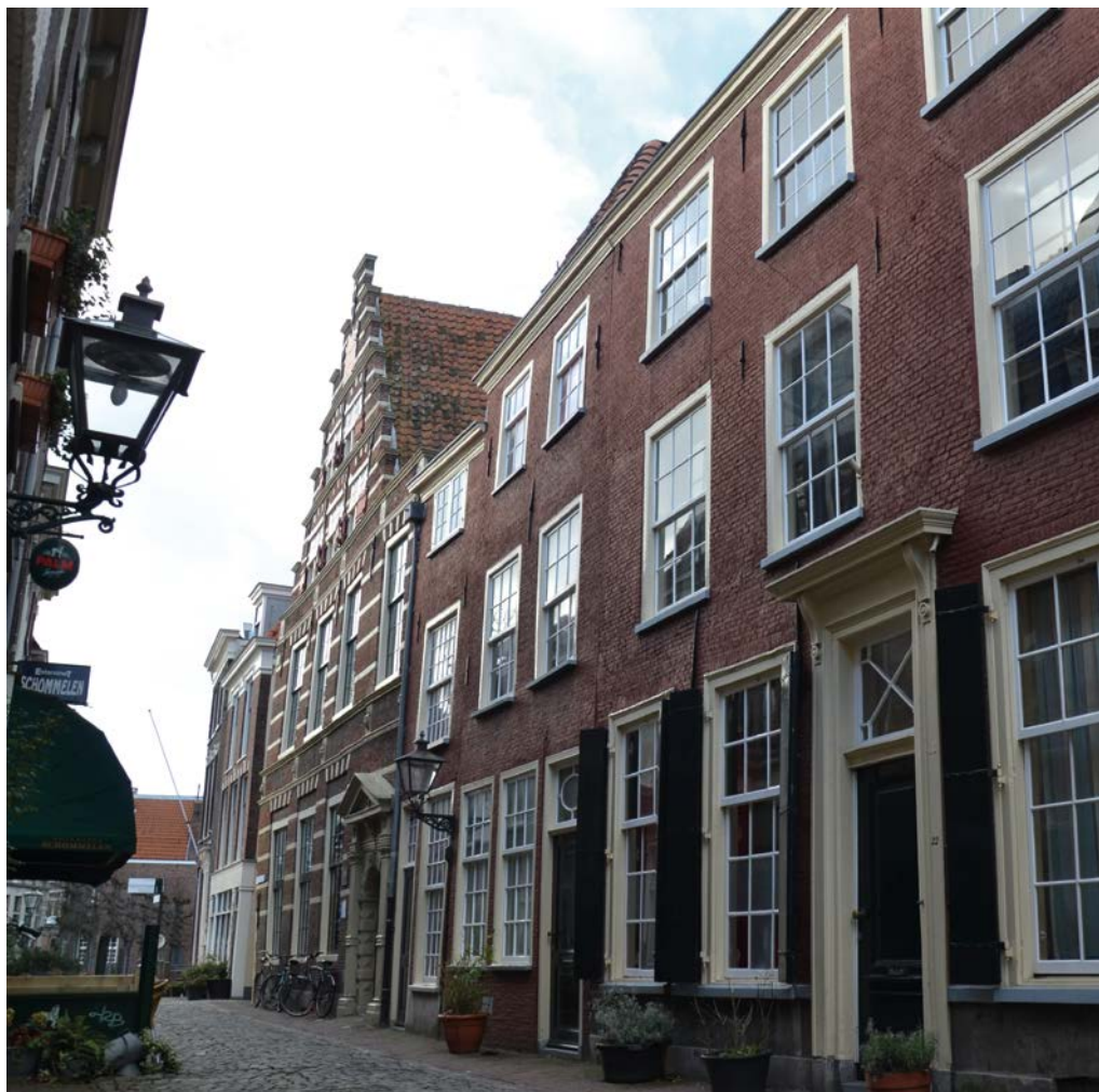
De Latijnse School en Lokhorststraat 18, 20 en 22.

noten gekraakt over het Leidse monumenten- en binnenstadsbeleid in zijn algemeenheid.