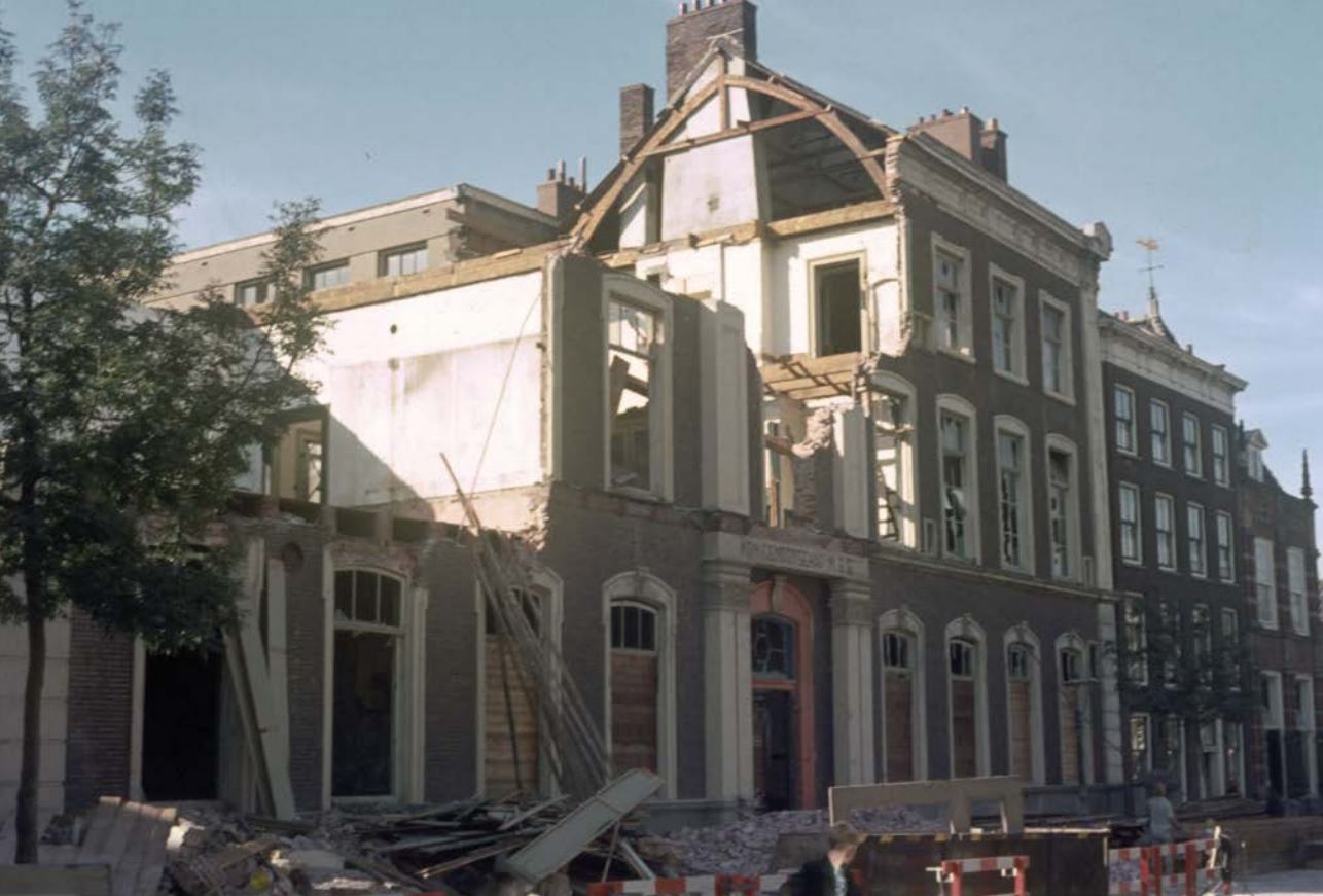
Het gebouw van MSG aan de Pieterskerkgracht tijdens de sloop.