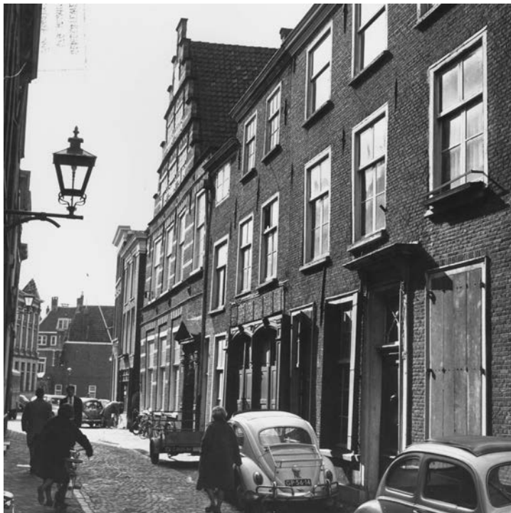
De panden Lokhorststraat 18, 20 en 22, met links de Latijnse School en gezicht op het Gerecht.