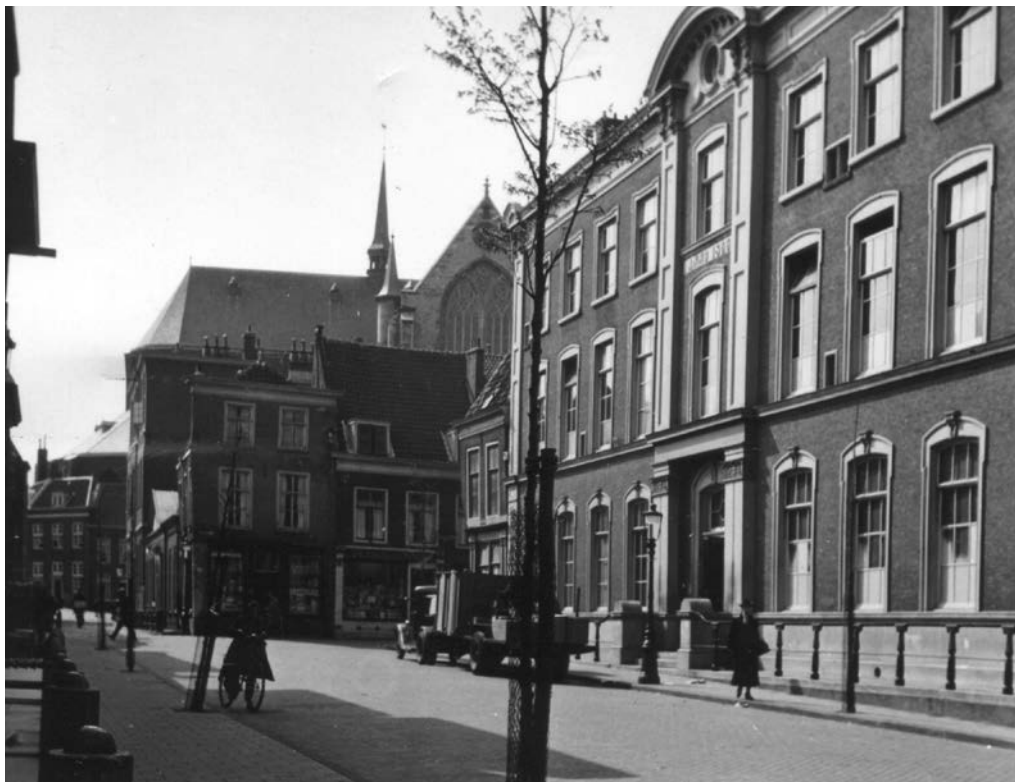
Het gebouw van MSG aan de Pieterskerkgracht. Op de achtergrond de hoek van de Lokhorststraat en daarachter de Pieterskerk. Foto: 1943. Beeldbank HVOL.

School bij voorkeur buiten het plan zou houden, maar hij was bang dat het grondoppervlak dan te klein zou worden. Hij noemde de mogelijkheid om het naast MSG staande woonhuis Pieterskerkgracht 11 bij het plan te betrekken. Dat pand was ook van de gemeente, maar een moeilijkheid was dat de gevel van het pand op de voorlopige monumentenlijst stond. 13 Van Schaik zei dat in beginsel ook Pieterskerkgracht 9, waar het kunstgenootschap Ars Aemula Naturae 14 was gevestigd, kon worden meegenomen,